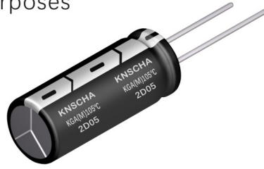
ΦD < 13mm