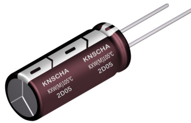
\phi D < 13\text{mm}